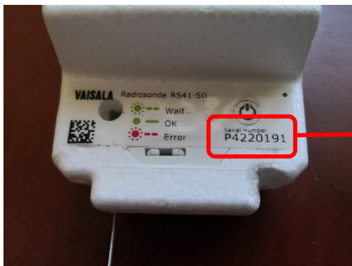
Sériové číslo na obale rádiosondy

Taktiež ak nie je čitateľné sériové číslo je možné ho nájsť na zadnej strane pásika snímačov.