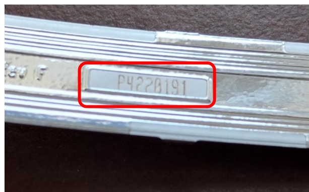
Detail sériového čísla na pásiku senzorov